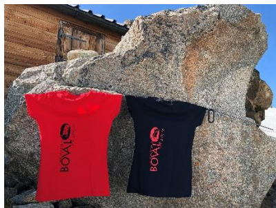
T-Shirt rot oder schwarz CHF 20.--