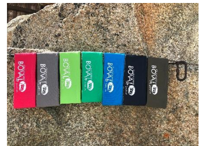
Stirnband verschiedene Farben CHF 18.--

Ansichtskarte mit Hüttenstempel CHF Klein CHF 1.50 Gross CHF 2.--