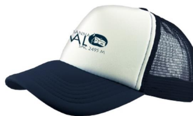
Cap blau CHF 18.--